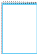
spiralowanie górne margines wewnętrzny górny - 11 mm pozostałe - 5 mm